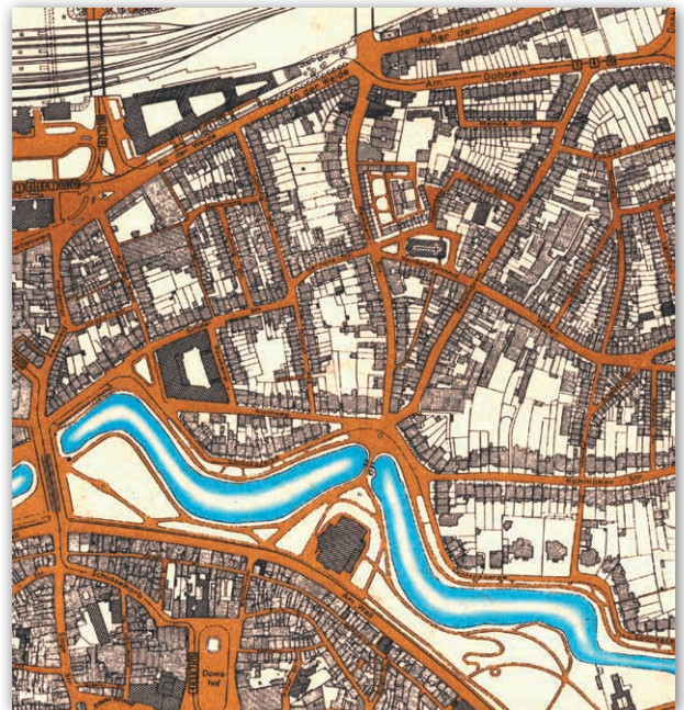
Karte der Freien Hansestadt Bremen 1938