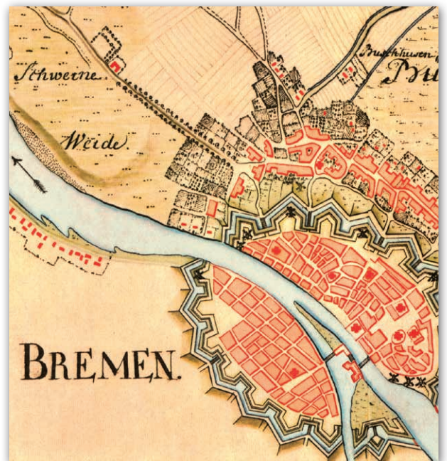
Karte von Osterholz und Bremen im 18. Jahrhundert

Original Staatsarchiv Bremen Maßstab Ca. 1 : 2 900