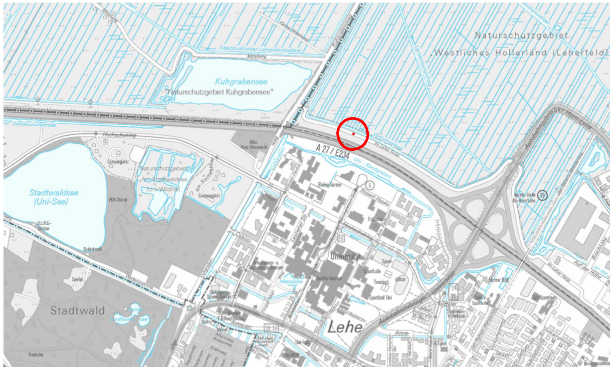
Stadtplan 1: 20 000