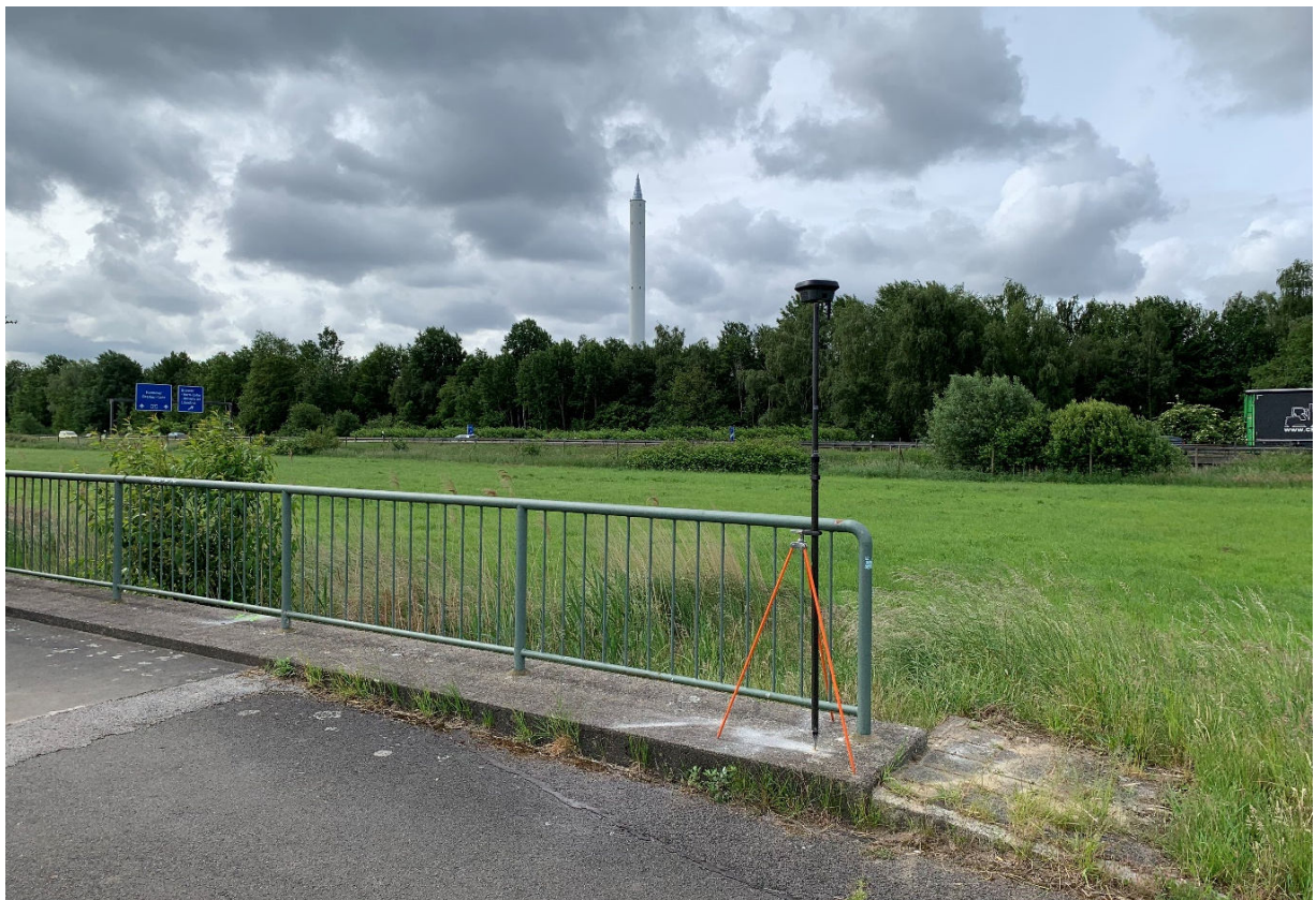
Blickrichtung Fallturm / A27