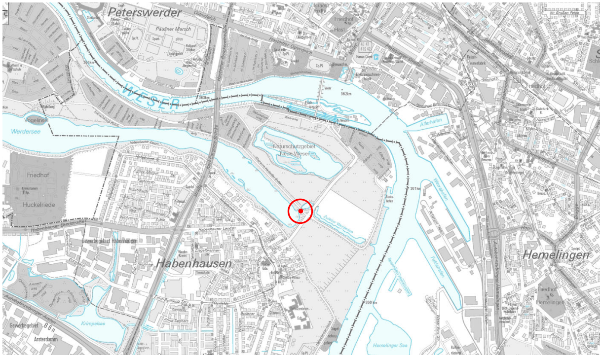
Stadtplan 1:20 000