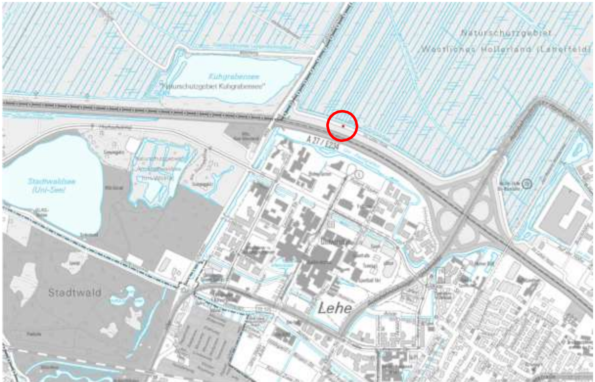
Stadtplan 1: 20 000