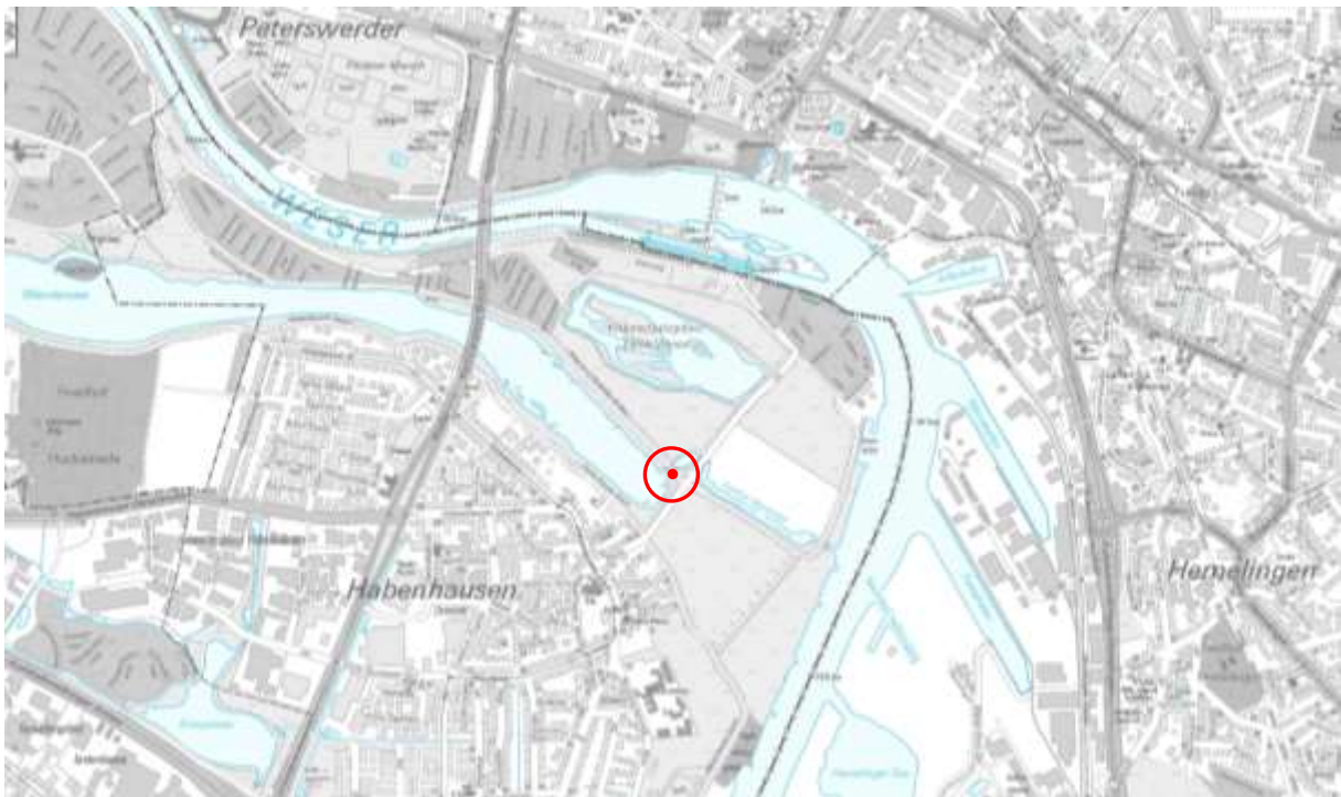
Stadtplan 1:20 000